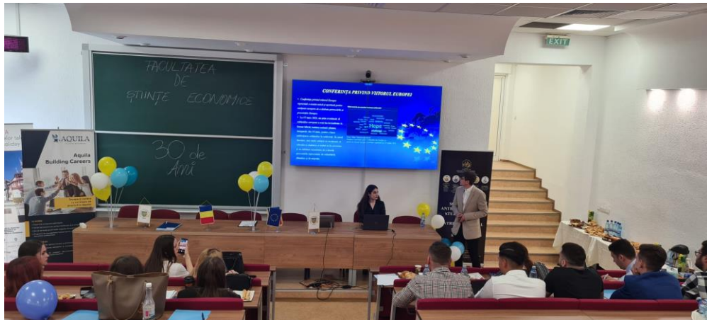
15:30- Festivitatea de Premiere on-line și în sala FA1